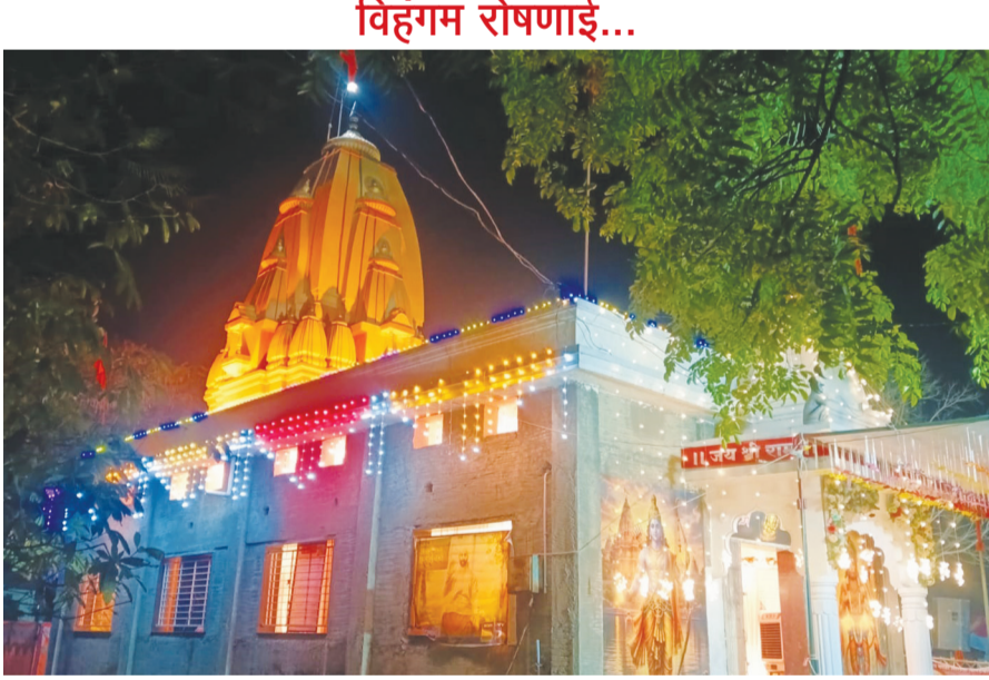
अकोला: श्री. हनुमान जयंती निमित्त शहरातील राम नगर येथील श्री. हनुमान मंदिरांवर अशी विहंगम रोषणाई करण्यात आली.

एकीकडे कंत्राटदार एकट नाहीत आणि दुसरीकडे महापालिका प्रशासन स्थानिक लोकप्रतिनिधींच्या तक्रारीकडे दुर्लक्ष करत आहे. जनतेला उरदारदायी असलेल्या लोकप्रतिनिधींना प्रशासन साधे उतर देण्याचे सोजूनही दाखवत नसल्याने संताप व्यक्त होत आहे. पावसाळा जवळ येण्यापूर्वी ही कामे पूर्ण न झाल्यास शहराची अवस्था अधिकच दयनीय होण्याची भीती व्यक्त केली जात आहे. आता आयुक्त या प्रकरणात लक्ष घालून संबंधित कंत्राटदारांवर कोठार कारवाई करणार का, याकडे लक्ष लागले आहे.