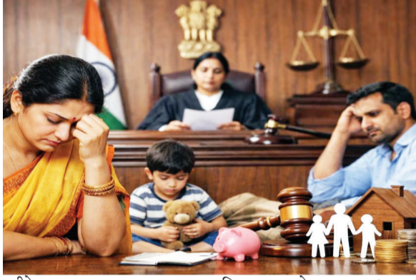
पतीने उच्च न्यायालयात आव्हान दिले.

नागपूर, दि. १ : पत्नी काही प्रमाणात उत्पन्न मिळवत असली तरी ते तिच्या उपजीविकेसाठी पुरेसे आहे का, याचा विचार केल्याशिवाय पोटागी नाकारता येत नाही, असे स्पष्ट करत मुंबई उच्च न्यायालयाच्या नागपूर खंडपीठाने पतीची पुनर्विचार याचिका फेटाळली. परिणामी, पत्नी व मुलाला प्रत्येकी दरमहा दोन हजार पोटागी देण्याचा कुटुंब न्यायालयाचा आदेश कायम ठेवण्यात आला.