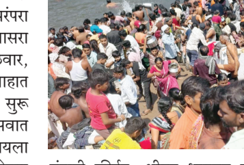
यंदाही कीर्तन, श्रीमद भागवत कथा, भजन आणि प्रबोधनात्मक प्रवचनांचे आयोजन करण्यात आले होते. महाराष्ट्रभरातील ख्यातीप्राप्त कीर्तनकार व भागवतकारांनी आपल्या वाणीने भाविकांना मंत्रमुग्ध केले. यात्रेचे मुख्य आकर्षण असलेल्या रोडग्यांच्या

बार्शीटाकळी, दि. ३१ : तालुक्यातील दोनद खुर्द येथे ऐतिहासिक परंपरा लाभलेल्या ग्रामदैवत आई आसरा देवीचा यात्रा महोत्सव मंगळवार, ३१ मार्च रोजी अत्यंत उत्साहात संपन्न झाला. २९ मार्चपासून सुरू झालेल्या या तीन दिवसीय महोत्सवात धार्मिक कार्यक्रमांची रेलचेल पाहायला मिळाली. श्रद्धेचा जनसागर उमळलेल्या या यात्रेत अकोला जिल्ह्यासह पंचक्रोशीतील लाखो भाविकांनी आई आसरा देवीचे दर्शन घेऊन आशीर्वाद घेतल्या. यात्रेच्या निमित्ताने गावात भक्तीचा मळा फुलला होता. दरवर्षीप्रमाणे