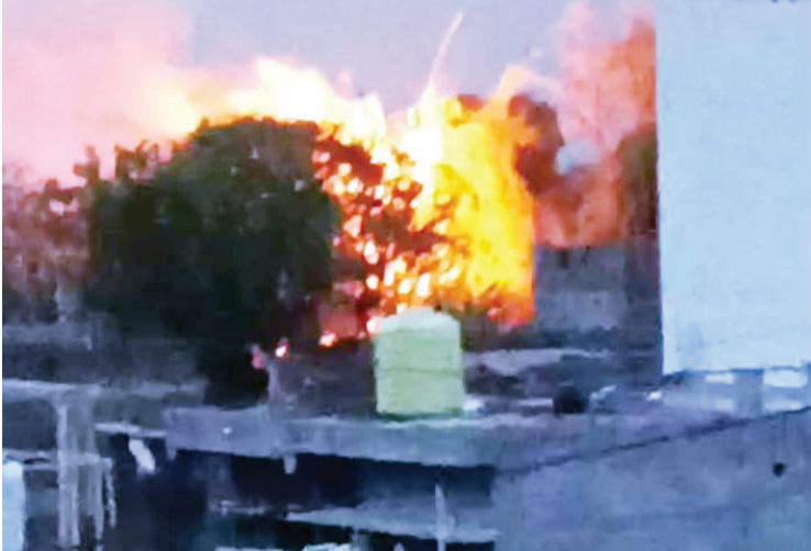
होता की, वीज थेट झाडांवर कोसळली. कोसळल्याचा भास झाल्याने ग्रामस्थांमध्ये विजेच्या प्रचंड प्रतापाने क्षणात ३ ते ४ मोठी पळापळ झाली. सुदैवाने, स्थानिक झाडांनी पेट घेतला. आकाशातून आग नागरिकांनी प्रसंगावधान राखून तातडीने

अकोला, दि. ३१ : जिल्ह्यात गेल्या काही दिवसांपासून सुरू असलेल्या कडाक्याच्या उन्हामुळे हेराण झालेल्या नागरिकांना गुरुवारी सायंकाळी अवकाळी पावसाने झोडपले. मात्र, हा पाऊस सुखावह ठरण्याऐवजी विजांच्या कडकडाटासह आल्याने नागरिकांची मोठी तारांबळ उडाली. अकोला शहराजवळील बाबुळगाव परिसरात विजेचा मोठा प्रपात होऊन चक्र झाडांनी पेट घेतल्याची धक्कादायक घटना घडली. यामुळे परिसरात काही काळ दहशतीचे वातावरण निर्माण झाले होते. दिवसभर असह्य उकाडा अनुभवल्यानंतर सायंकाळच्या सुमारास अचानक ढग दाटून आले आणि सोसाट्याच्या वाऱ्यासह पावसाला सुरुवात झाली. बाबुळगाव परिसरात विजांचा कडकडाट इतका भीषण