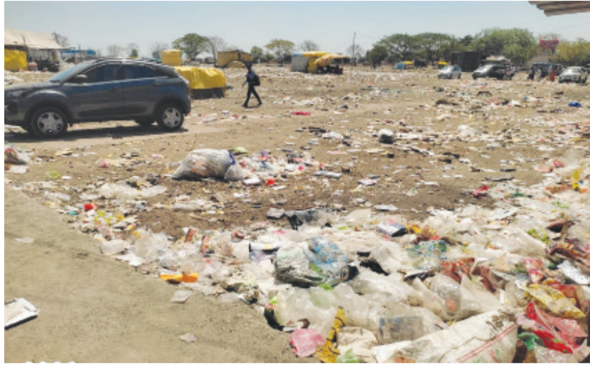
आणि उरलेले अन्न परिसरात अस्ताव्यस्त पडलेले असते. हाच कचरा खाल्ल्यामुळे गेल्या दोन

मानोरा, दि. ३१ : बंजारा समाजाचे श्रद्धास्थान असलेल्या पोहारादेवी येथे दोन दिवसांपूर्वी पार पडलेल्या यात्रोत्सवानंतर भीषण परिस्थिती निर्माण झाली आहे. प्रशासनाने यात्रेनंतर कचरा व्यवस्थापनाकडे पूर्णपणे दुर्लक्ष केल्यामुळे, परिसरात पडलेला प्लास्टिक कचरा खाऊन अनेक गार्गीचा मृत्यू झाला आहे. या मृत जनावरांमुळे मंदिर परिसरात दुर्गंधी पसरली असून नागरिकांच्या आरोग्याचा प्रश्न गंभीर झाला आहे. पोहारादेवी येथील जगदंबा माता मंदिर, संत सेवालाल महाराज आणि बापू रामराव महाराज यांच्या दर्शनासाठी देशभरातून लाखो भाविक येतात. रामनवमी आणि संत सेवालाल महाराज जयंतीनिमित्त भरणाऱ्या यात्रेत मोठ्या प्रमाणात दुकाने थाटली जातात. यात्रा संपल्यानंतर विक्रेते आणि भाविकांनी टाकलेला प्लास्टिक कचरा