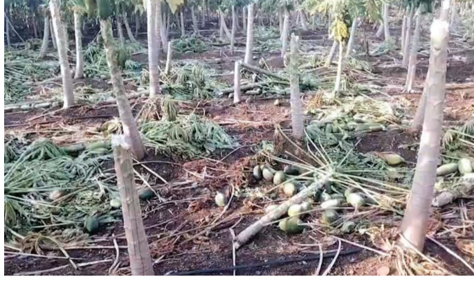
सोमवारी दुपारी झालेल्या वादळी वाऱ्यासह अवकाळी पावसामुळे अकोला तालुक्यातील सुकळी नंदापूर येथे पपई व कांदाचे झालेले नुकसान.

पुढील चार दिवस जिल्ह्यात काही ठिकाणी पावसाचा अंदाज ३१ मार्च रोजी हवामान विभागाकडून वर्तवण्यात आला आहे. त्यामुळे शेतकरी पुन्हा धास्तावले आहेत. गतवर्षी सरासरी पेशा जास्त पाऊस जिल्ह्यात झाला होता. जिल्ह्यात वर्षात सरासरी