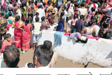
महाप्रसादाचा लाभ हजारो भक्तांनी घेतला. घराघरांत पाहुण्यांची मांदियाळी आणि आसरा मातेचा जयघोष यामुळे संपूर्ण दोनद खुर्द परिसर भक्तिमय झाला होता. "आसरा देवी मातेच्या यात्रेला मोठी ऐतिहासिक परंपरा आहे. दरवर्षीप्रमाणे