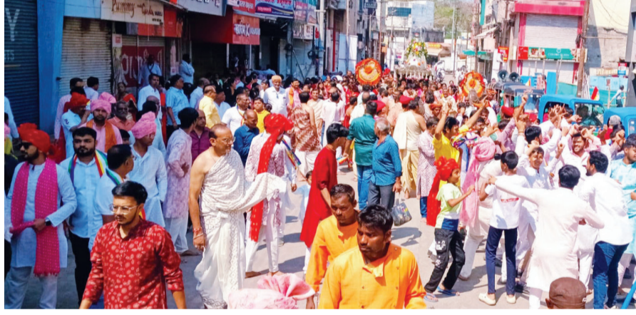
अकोला: भगवान महावीर जयंती निमित्त शहरातील गांधी रोड परिसरातील मोठे जैन मंदिर येथुन टिळक रोड मार्गे भव्य शोभायात्रा काढून जुना भाजी बाजार ते जैन मंदिर येथे समारोप करण्यात आला. या शोभायात्रेत जैन बांधव व महिला मोठ्या संख्येने उपस्थित झाले होते.