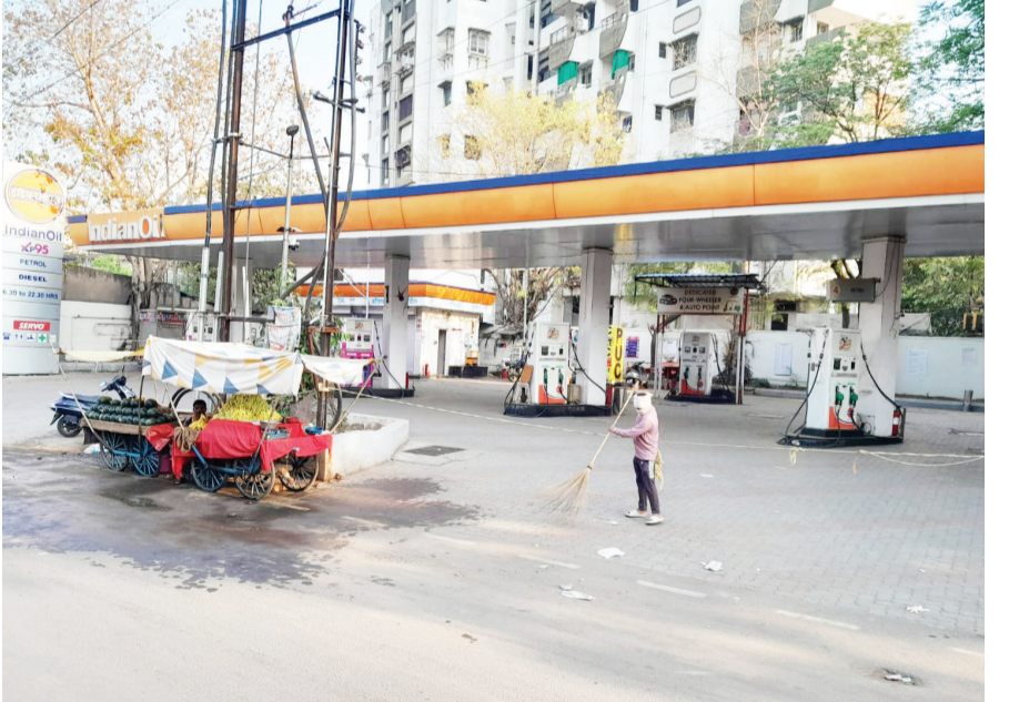
नागपूर: उपराजधानीतील पेट्रोल-डिझेल पुरवठ्यासंदर्भातील स्थिती अद्यापही स्पष्ट झालेली नाही म्हणूनच सकाळपासूनच शहरातील पेट्रोल पंपांवर गर्दी होत आहे. मेडिकल चौकातील पंप आज तिसऱ्या दिवशीही बंद असल्याचे दिसून आले.