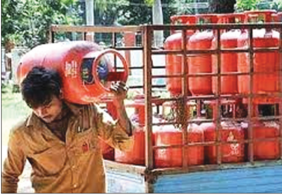
असून त्यांना पंधरा दिवसांनंतर गॅस सिलिंडर घरपोच मिळणार असल्याचे सांगितले जात आहे. विशेष म्हणजे बुकिंग झाल्यावर वितरकांना ओटीपी आल्यानंतर सिलिंडर वितरकामार्फत घरपोच

जालना, दि. २६ : गेल्या काही दिवसांपासून गॅस टंचाईने हेराण झालेले नागरिक सिलिंडरसाठी गॅस एजन्सीसमोर सकाळी सात वाजेपासूनच रंगा लावताना दिसत आहेत. दुसरीकडे ऑनलाइन गॅस बुकिंग झाल्यानंतर वितरकांकडून घरापर्यंत गॅस घेऊन जाण्यास आढेवेढे घेतले जात आहेत. त्यामुळे नागरिकांना नाईलाजाने उन्हातान्हात भटकती करावी लागत आहे. एजन्सीकडून बुकिंग केल्यानंतर सिलिंडरचे पेमेंट करून स्वतःच गोदामावरून सिलिंडर घरी घेऊन जावे लागत आहे. अशाही परिस्थितीत काही नागरिक ऑनलाइन गॅस बुकिंग करत