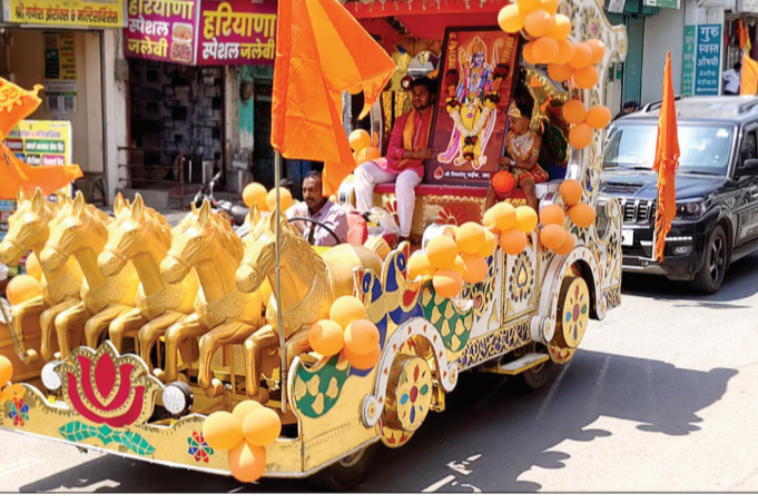
आज गुरुवारी रोजी रामनवमी निमित्त जालना शहरातील संभाजी उद्यान या ठिकाणाहून रॅलीचे आयोजन करण्यात आले होते. ही रॅली कचेरीरोड, शनिमंदिर, गांधी चमन, मुथा बिल्डिंग, पाणीवेस, शिवाजी पुतळा मार्गे श्रीराम मंदिर या ठिकाणी विसर्जित करण्यात आली. या रॅलीत तरुण-तरुणींसह अबालवृद्धांनीही मोठ्या उत्साहात सहभाग घेतला होता.