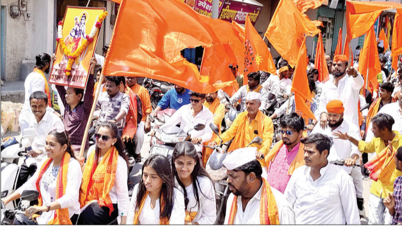
आज गुरुवारी रोजी रामनवमी निमित्त जालना शहरातील संभाजी उद्यान या ठिकाणाहून रॅलीचे आयोजन करण्यात आले होते. ही रॅली कचेरीरोड, शनिमंदिर, गांधी चमन, मुथा बिल्डिंग, पाणीवेस, शिवाजी पुतळा मार्गे श्रीराम मंदिर या ठिकाणी विसर्जित करण्यात आली. या रॅलीत तरुण-तरुणींसह अबालवृद्धांनीही मोठ्या उत्साहात सहभाग घेतला होता.

काटेकोर पालन करणे आवश्यक असून, उल्लंघन करणाऱ्यांवर जीवनावश्यक वस्तू अधिनियम, १९५५ अंतर्गत कडक कारवाई करण्यात येणार असल्याचा इशारा प्रशासनाने दिला आहे. सदर आदेश तात्काळ प्रभावाने लागू करण्यात आला असून, पुढील आदेशापर्यंत तो लागू राहणार आहे.