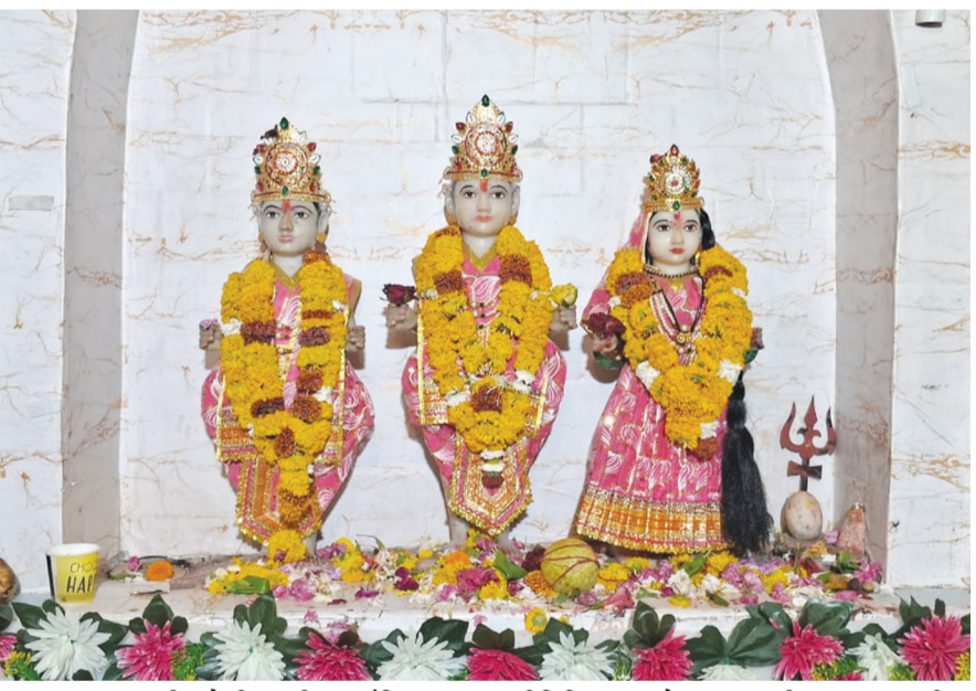
बाभुळगाव जहागीर येथील श्रीराम मंदिरात रामनवमीनिमित्त सजलेला प्रभू श्रीराम, माता सीता आणि लक्ष्मण यांचा दरबार. आकर्षक फुलांची सजावट आणि अलंकारांनी मढलेल्या मूर्तीचे हे विलोभनीय रूप पाहताच भाविक नतमस्तक झाले.