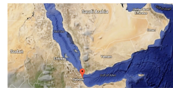
आखाती देश आधीच झगडत असताना, इराण आता आणखी एका मार्गावर अडथळे निर्माण करण्याची तयारी करत आहे. ज्यामुळे अनेक देशांसमोर तेलाचे

इराण, अमेरिका आणि इस्रायल यांच्यातील संघर्ष सुरू झाल्यापासून, जागतिक चर्चेत 'हॉर्मुझची सामुद्रधुनी' हा विषय चर्चेत राहिल. कारण हा एक अत्यंत महत्त्वाचा जलमार्ग असून ज्यातून जगातील २० टक्के कच्च्या तेलाची आणि लाखो टन नैसर्गिक वायूंची वाहतूक होते. भारताचाही ऊर्जेच्या गरजांचा मोठा भाग याच मार्गाद्वारे पूर्ण केला जातो; मात्र, इराणने सध्या या मार्गावर कडक नाकेबंदी लागू केली आहे. हॉर्मुझची २० सामुद्रधुनी बंद झाल्यामुळे निर्माण झालेल्या परिणामांशी आशियाई आणि