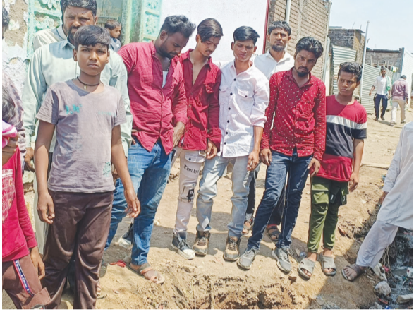
प्रशासनाला दिला आहे. दर तिसऱ्या दिवशी पुरेसा शहरातील इतर प्रभागाना पाणीपुरवठा होत असताना, प्रभाग