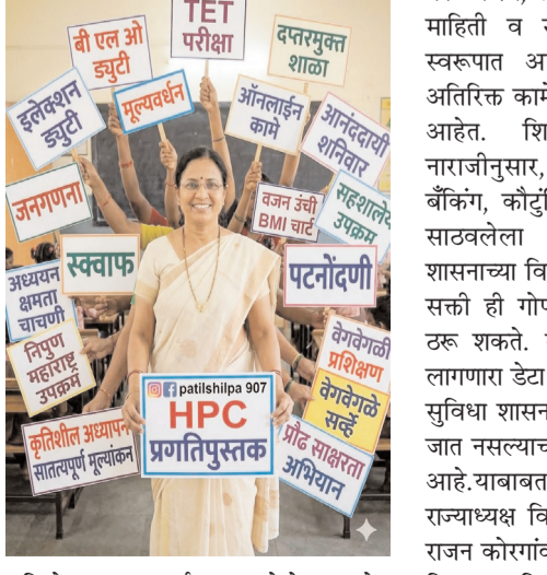
प्रक्रियेत गुगल ड्राईव्हवर फोटो अपलोड करणे, त्याच्या लिंक तयार करून अॅपमध्ये

अमरावती, दि.२६ : राज्यातील शिक्षकांवर दिवसेंदिवस ऑनलाईन कामाचा ताण वाढत असून, यासाठी वैयक्तिक मोबाईलचा सक्तीने वापर करावा लागत असल्याने शिक्षकांमध्ये तीव्र नाराजी व्यक्त होत आहे. महाराष्ट्र राज्य प्राथमिक शिक्षक समितीने या संदर्भात शासनाच्या धोरणावर प्रश्नचिन्ह उपस्थित करत आंदोलनाचा इशारा दिला आहे.वरीष्ठ अधिकारी एसीत बसून नवनविन उपक्रम राबवत आहे.याचा जास मुख्याध्यापक,शिक्षक यांना होत आहे. निपुण चाचणीपासून सुरु झालेली मोबाईल वापरची सक्ती आता 'स्क्रॉफ' (स्फूर्ण) माहिती भरण्यापर्यंत वाढली असून, प्रत्येक शिक्षकाला स्वतःच्या मोबाईलमध्ये विविध ऑप डाउनलोड करून त्यावर काम करणे बंधनकारक करण्यात आले आहे. या