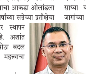
तारिक रहमान यांच्या नेतृत्वाखालील पक्षाने २००९ मध्ये शेवटची निवडणूक जिंकली होती. मतमोजणीच्या ट्रेडमध्ये प्रचंड विजय दिसून येत असल्याने पक्षाने आज विजयाची घोषणा केली आणि दोन दशकांनंतर पुन्हा सत्तेत येण्याची खात्री पटली. दरम्यान, जमात-ए-इस्लामीला मोठा धक्का बसला, निकालांची संथ गती असूनही ते दुहेरी अंकी जागांपर्यंत

बांगलादेश नॅशनलिस्ट पार्टी (बीएनपी) १३ व्या सार्वत्रिक निवडणुकीत बहुमताचा आकडा ओलांडला आहे. या विजयानंतर २० वर्षांच्या सत्तेच्या प्रतीक्षेचा अंत करत पुढील सरकार स्थापन करण्यास सज्ज झाली आहे. अशांत देशाच्या राजकीय दिशेने मोठा बदल घडवून आणणारा हा एक महत्त्वाचा जनारंश आहे.