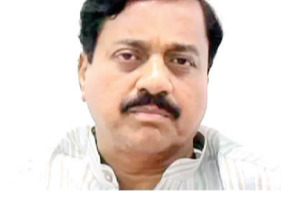
मुंबई, दि. १३ वृत्तसंस्था

* प्रस्ताव आल्यास भाजपला विश्वासात घेणे अनिवार्य - सुनील तटकरे * पटेल, तटकरे यांना खलनायक का ठरवले जात आहे? - हसन मुश्रीफ