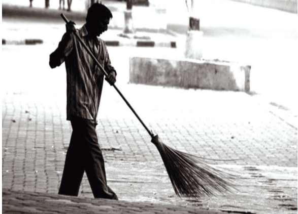
महापालिका प्रशासनाने ५१ नियुक्त करण्याची प्रक्रिया सुरू केली भागांसाठी ५१ स्वतंत्र कंत्राटदार आहे. प्रत्येक भागात १२ मजूर,

अकोला, दि. १३ : शहरातील स्वच्छतेचा प्रश्न कायम चर्चेत असतानाच, आता महापालिका क्षेत्रातील ५१ वॉर्डांतील सफाईचा खर्च प्रशासनाच्या तिजोरीवर मोठा भार टाकणार आहे. विशेष म्हणजे, यापूर्वीही याच भागात कंत्राटी पद्धतीने स्वच्छता केली जात होती; मात्र आता हा वार्षिक खर्च थेट ६ कोटींवरून ११ कोटींवर पोहोचला आहे. सोमवारी होणाऱ्या महासभेत या पडोळी वॉर्डांतील वाढीव खर्चाच्या मुद्द्यावर वादळी चर्चा होण्याची शक्यता आहे.