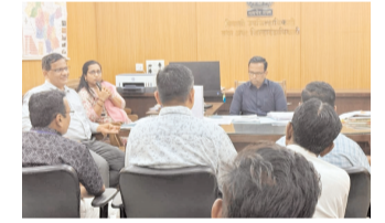
बैठक पार पडली. महसूल मंत्री तथा अमरावती जिल्ह्याचे पालकमंत्री चंद्रशेखर बावनकुळे यांच्याकडे सादर

अंजनागव बारी, दि.१३ : स्वामित्व योजनेअंतर्गत झोन सर्व्हे करून तयार करण्यात आलेल्या पीआर कार्ड (मालमत्ता पत्रक) प्रक्रियेमुळे अमरावती तालुका व जिल्ह्यात निर्माण झालेल्या गंधीर समस्यांच्या पार्श्वभूमीवर आज निवासी उपजिल्हाधिकारी कार्यालय, अमरावती येथे महत्त्वपूर्ण