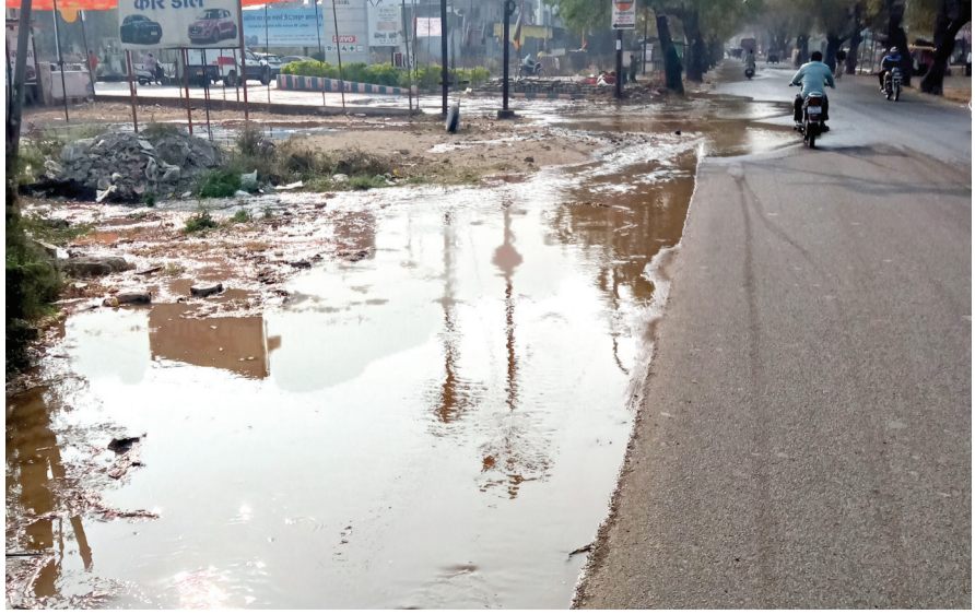
दुचाकीस्वारांना अपघाताचा धोका निर्माण झाला होता. सकाळच्या वर्दळीच्या वेळी ही चिखलातून मार्ग काढताना घटना घडल्याने पादचाऱ्यांना मोठी कसरत करावी लागली,

अकोला, दि. १३ : कौलखेड चौकातील मुख्य रस्त्यावर इंटरनेट केबल टाकण्याच्या कामादरम्यान मुख्य जलवाहिनी फुटल्याची घटना शुक्रवारी सकाळी घडली. एअरटेल कंपनीच्या एचडीडी मशीनद्वारे सुरू असलेल्या भूमिगत कामावेळी पाईपलाईन तुटल्याने पाण्याचा प्रचंड प्रवाह रस्त्यावर वाहू लागला. बराच वेळ पाणी वाहत राहिल्याने हजारो लिटर पाणी वाया गेल्याने नागरिकांनी संताप व्यक्त केला आहे.