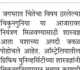
अवलंबली आहे. शास्त्रज्ञांनी या बॅक्टेरियाचा वापर एखाद्या 'छोट्या फॅक्टरी' सारखा केला आहे. या बॅक्टेरियाच्या मदतीने अतिसूक्ष्म बायोप्रॉलिमर कण तयार करण्यात आले असून, त्यावर चिकुनगुनिया व्हायरसचे 'अँटीजन' लावले आहेत. हे कण दिसायला