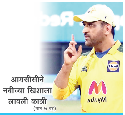
आयसीसीने नवीच्या खिशाळा लावली कात्री (पान ७ वर)