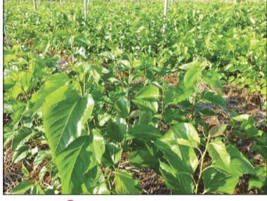
जिल्ह्यात पाच हजार एकरवर तुती लागवडीचे लक्ष्य

जालना, दि. १३ : जालना जिल्ह्यातील शेतकऱ्यांनी पारंपरिक शेतीला फाटा देऊन शाश्वत उत्पन्नासाठी रेशीम उद्योगाकडे वळावे, या उद्देशाने राबविण्यात येणाऱ्या मनरेगा, सिल्क समग्र आणि पोकरा-२ (हवामान अनुकूल कृषी प्रकल्प) या योजनेचा समावेश आहे. या योजनेच्या माध्यमातून शेतकऱ्यांना अनुदान आणि तांत्रिक साहाय्य उपलब्ध करून दिले जाणार आहे. या त्रिवेणी संगमाचा लाभ घेऊन अधिकाधिक शेतकऱ्यांनी आपली नोंदणी करावी, असे आवाहन प्रशासनाकडून करण्यात आले आहे. दि. ४ फेब्रुवारी ते ५ मार्च २०२६ पर्यंत अभियान कालावधी असून गावोगावी फिरणारा रेशीम चित्रथ शेतकऱ्यांना तुती लागवडीच्या तांत्रिक माहितीसह नोंदणीसाठी प्रोत्साहित करणार आहे. रेशीम विभाग, मनरेगा, पंचायत समिती आणि कृषी विभाग संयुक्तपणे ही मोहीम राबविणार आहेत.