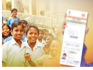
पुरावा उपलब्ध नसल्याने त्यांची आधार नोंदणीच होऊ शकत नाही, अशी भीषण तांत्रिक अडचण उभी राहिली आहे.

असून, या गंभीर प्रश्नामुळे प्रशासकीय अनास्थेवर संताप व्यक्त होत आहे. येथील शेकडो विद्यार्थी शिक्षणाच्या मुख्य प्रवाहापासून केवळ कागदपत्रांअभावी दूर फेकले जात आहेत. आधार कार्ड नसल्यामुळे विद्यार्थ्यांची नावे ऑनलाईन पोर्टलवर नोंदवणे, शासकीय शिष्यवृत्ती आणि मोफत गणवेश, शालेय पोषण आहार यांसारख्या लाभांपासून हे विद्यार्थी वंचित राहत आहेत. विशेष म्हणजे, या विद्यार्थ्यांकडे जन्माचा कोणताही टोस