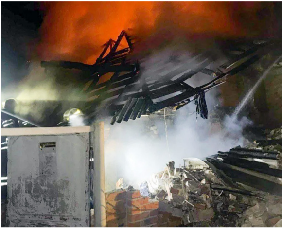
(११ फेब्रुवारी) रात्री १०० हून अधिक ड्रोनचा मार केला होता. या हल्ल्यात युक्रेनमधील खाकिव्ह प्रदेशाला लक्ष्य करण्यात आले होते. या हल्ल्या शहरातील एक घर पूर्णपणे उद्ध्वस्त झाले

रशिया आणि युक्रेन युद्धाला आता तीन वर्षांहून अधिक काळ पलटून गेला आहे. या युद्धामुळे युक्रेनमध्ये मोठ्या प्रमाणात पायाभूत सुविधांचे नुकसान झाले आहे. सध्या आंतरराष्ट्रीय पातळीवरे हे युद्ध थांबवण्यासाठी अमेरिका प्रयत्न करत आहे. परंतु अद्याप यावर टोस निर्णय झालेला नाही. याच वेळी रशियाचा युक्रेनमध्ये प्रहार सुरुच आहे. रशिया सतत युक्रेनवर ड्रोन हल्ले करत आहे. अलीकडेच झालेल्या ताज्या हल्ल्यात युक्रेनच्या संपूर्ण कुटुंबाचा बळी घेतला आहे. चिमुकल्यांसह एकाच कुटुंबातील चार जणांचा मृत्यू युक्रेनच्या अधिकाऱ्यांनी दिलेल्या माहितीनुसार, रशियाने बुधवारी