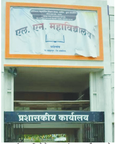
पारदर्शक प्रक्रियेचे पालकांमधून कौतुक होत आहे.

दिग्गज बु., दि. १२ : बाळापूर तालुक्यातील वाडेगाव येथील एल. एन. कला महाविद्यालयात बारावीच्या परीक्षेला शिस्तबद्ध वातावरणात सुरुवात झाली. गुरुवारी पार पडलेला इंग्रजी विषयाचा पेपर केंद्रातील सर्व वर्गांमध्ये सीसीटीव्ही कॅमेऱ्यांच्या कडक निगराणीखाली आणि नियोजनबद्ध पद्धतीने पार पडला. राज्य मंडळाने जाहीर केलेले 'कॉपीमुक्त' अभियान या केंद्रावर प्रभावीपणे राबविण्यात येत आहे. परीक्षेदरम्यान कोणताही गोंधळ किंवा गैरप्रकार घडू नये, यासाठी केंद्र प्रशासनाने चोख व्यवस्था केली होती. विद्यार्थ्यांनीही कोणत्याही दबावाशिवाय आणि शिस्तबद्ध पद्धतीने पेपर दिल्याने केंद्र संचालकांनी समाधान व्यक्त केले आहे. ग्रामीण भागातील या परीक्षा केंद्रावर राबविण्यात आलेल्या