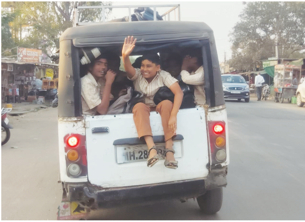
बाळापूर: शाळेकरी मुलांच्या जिवाशी खेळत आहेत वहन चालक.