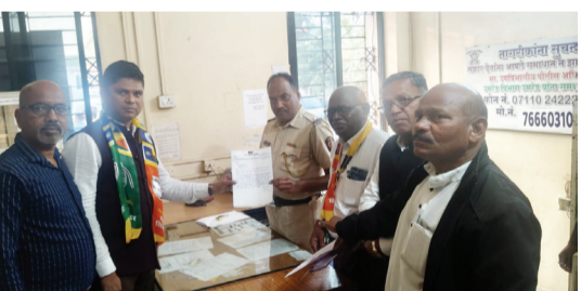
शुद्ध भावनेवरून हा अत्याचार केला असून वंचित बहुजन आघाडीने यांची दखल घेऊन आरंभोपरिवार अनुसूचित जातीय अत्याचार प्रतिबंधक कायद्याचे कलम असून गुन्हा दाखल करावा त्याला घर बांधून मिळावे उदरनिर्वाह करिता दहा लाख रुपये द्यावे,गुन्हेगार