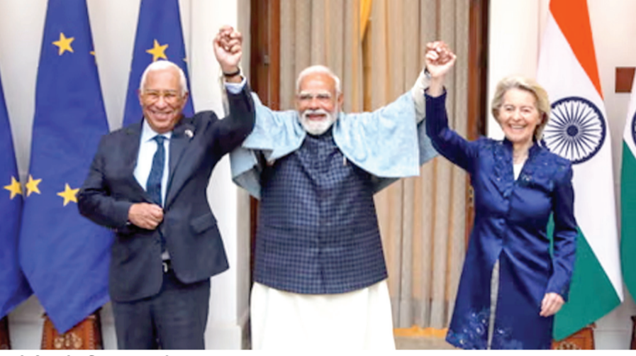
नवी दिल्ली, दि. २७ वृत्तसंस्था

भारत आणि युरोपियन युनियनमध्ये आज मुक्त व्यापार कराराची घोषणा करण्यात आली आहे. भारत आणि युरोपियन युनियन यांच्यातील 'मदर ऑफ ऑल डील' या करारवर स्वाक्षरी करण्यात आल्याने भारतासाठी हा ऐतिहासिक निर्णय मानला जात आहे. भारत आणि युरोपियन युनियनमधील हा करार म्हणजे 'सर्व करारांची जननी' असल्याचा उल्लेख पंतप्रधान मोदींनी केला आहे.