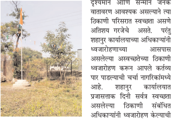
थातूरमातूर गवत काढण्यात आले.

अंजनगाव सुर्जी, दि. २७ : स्थानिक सिंचन व्यवस्थापन शाखा शहानुर कार्यालयात दिनांक २६ जानेवारी प्रजासत्ताक दिनाच्या दिवशी ध्वजारोहनाच्या ठिकाणी साफसफाई न करता आणि ध्वजस्तंभाला सुशोभित न करता अत्यंत लाजिरवाण्या परिस्थितीत ध्वजारोहन केल्याने अंजनगाव सुर्जी येथील स्थानिक नागरिकांनी याबाबत संबंधित अधिकाऱ्यांवर कारवाहीची मागणी होत आहे.