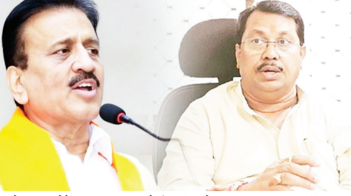
विरोध करत होते, त्यांनाच आज सत्तेची खुर्ची लाभली आहे. आंबेडकरांचे नाव घ्यायला यांना लाज वाटते, ही गंभीर बाब आहे. या देशात राष्ट्रध्याचा आणि सत्तेत बसण्याचा अधिकार संविधानामुळेच मिळतो. ज्यांच्या मनात संविधानच नाही, त्यांना सत्तेवर बसण्याचा अधिकार आहे का, असा सवालही त्यांनी केला. बाबासाहेबांचे नाव टाळणे हा अपघात बसण्याचा अधिकार संविधानामुळेच