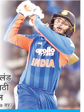
भारत आणि न्यूझीलंड उर्वरित सामन्यांसाठी संघात मोठे बदल (पान ७ वर)