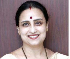
मुंबई, दि. २७ वृत्तसंस्था

आमच्याकडे संविधानाचे शस्त्र आहे- चित्रा वाघ