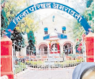
गर्ज असल्याची सुचना केली. ५० कोटींचा निधी सहा महिने रोखला